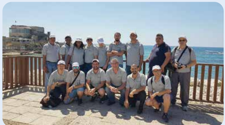
בקיסריה העתיקה עם הנוף לים התיכון

ב-12 השנים האחרונות הפכנו להיות די מפורסמים, יש לנו חשיפה אינטרנטית חזקה ובית הספר נחשב לאחד המוסדות ששווה להגיע ולהשתלם אצלם.