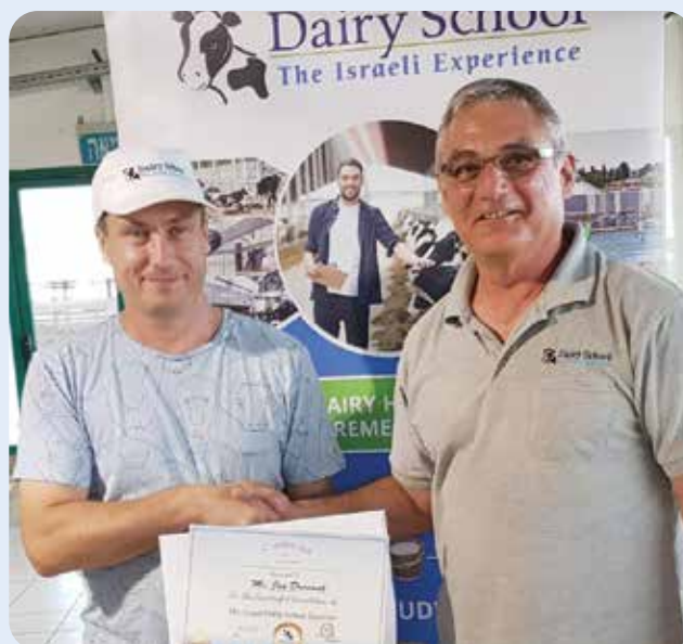
הסטודנטים חוזרים הביתה מרוצים וגם אוהבי ישראל