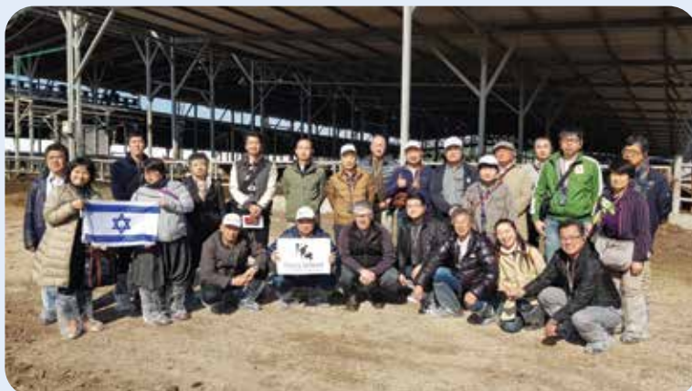
רפתנים מצפון יפן בסיור ברפת יפעת