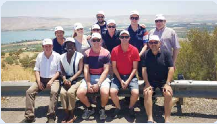
מטיילים בכל ארץ ישראל וגם בתצפית על הכנרת